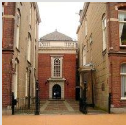
Doopsgezinde Kerk Groningen

Doopsgezinde mensen komen in het Noorden relatief veel voor. Klein, maar inspirerende Kerken. Lees hier hoe het in de doperse kerken in het Noorden vergaat